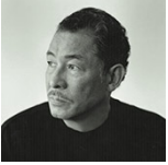
› Issey Miyake